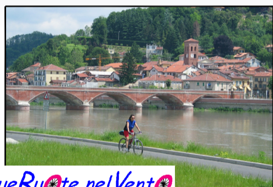
DueRuote nel Vento